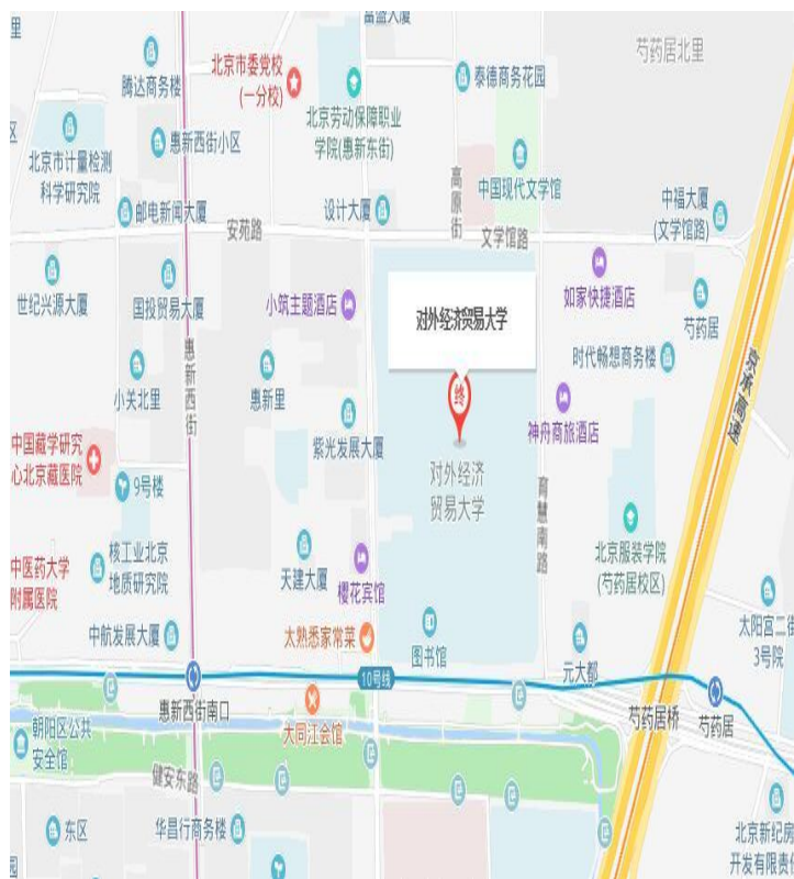
对外经济贸易大学位置